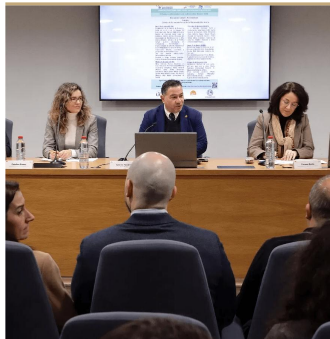
Inauguración de la Cátedra en Economía Social - Facultad de CC.EE. y Empresariales