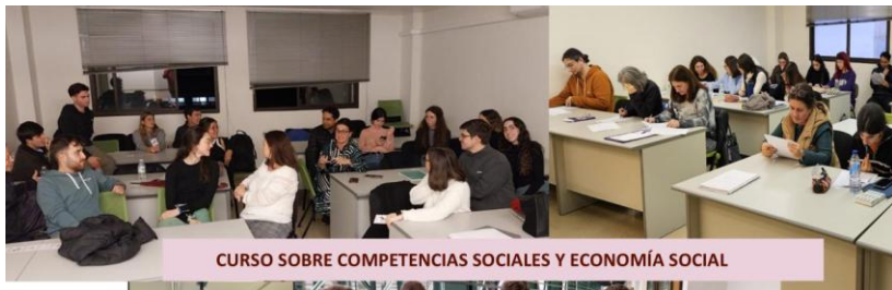
CURSO SOBRE COMPETENCIAS SOCIALES Y ECONOMÍA SOCIAL