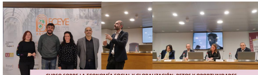
CURSO SOBRE LA ECONOMÍA SOCIAL Y GLOBALIZACIÓN: RETOS Y OPORTUNIDADES