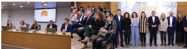
CURSO DE EMPRENDIMIENTO EN ECONOMÍA SOCIAL